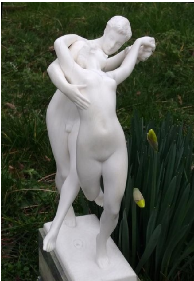
„La Danse“ – Charlesas Samuelis (1862–1935), „Ecole Belge“, 1913 m pirkta: ponis Janssens van der Maelen, Briuselis 2020 m

Su dviem priedais: 2 p. apie pirmąją žydų religiją ir 12 p., kaip jaunuoliai ir ypač merginos, nusiteikę aukštai moralei – dėl kultūros – siunčiami ne ta kryptimi.